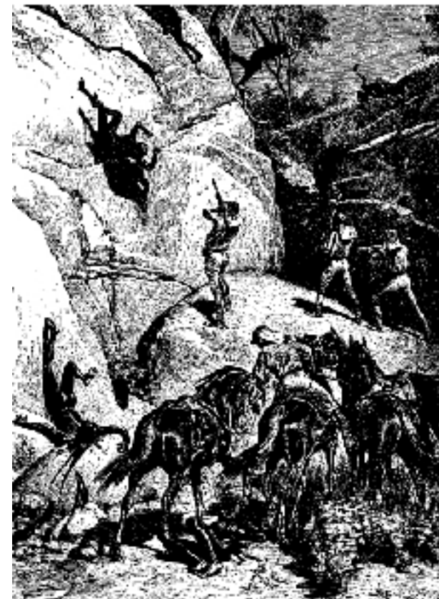
Carl Lumholtz 1889

Il y a un nom pour ces actes : génocide.