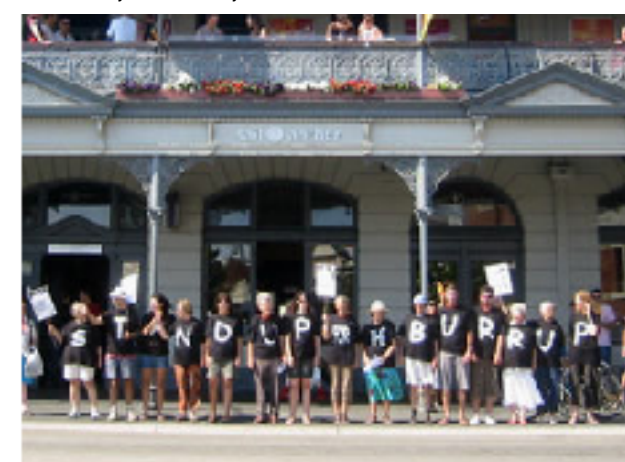
Australie, Perth, devant les bureaux de Woodside.