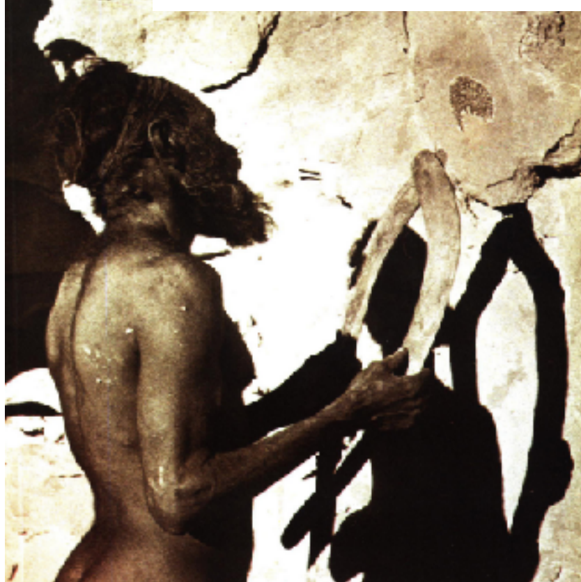
Tribu Pitjantjara, incantation devant une peinture rupestre

Le gouvernement australien honorerait en partie sa dette en prolongeant, par des mesures de protection adéquates, la sacralisation traditionnelle de ce lieu et la culture aborigène ancestrale.