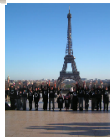
Paris, parvis des Droits de l’Homme.

Espagne, en Italie, en Allemagne, en Angleterre et au Brésil.